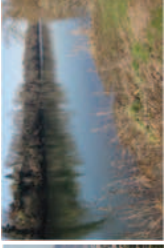
Aglomeración de Toulouse