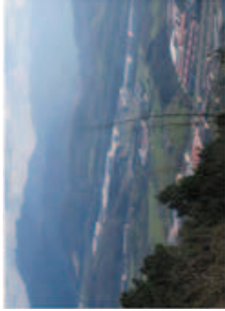
Diputación de Guipuzcoa