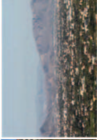
Región de Murcia