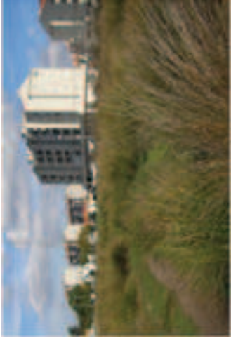
Aglomeración de Lisboa Barreiro/ Loures/Palmela